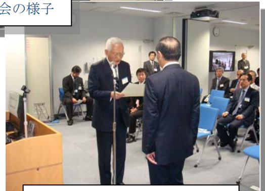
▲導入メーカーへの感謝状贈呈