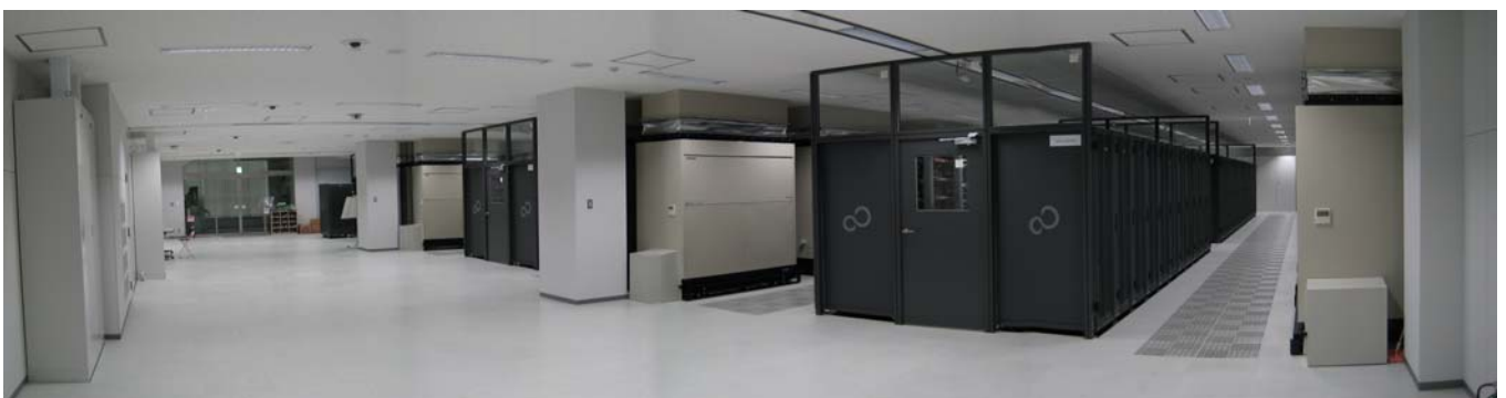
▲JSS (JAXA Supercomputer System) マシンルーム (850m 2 )